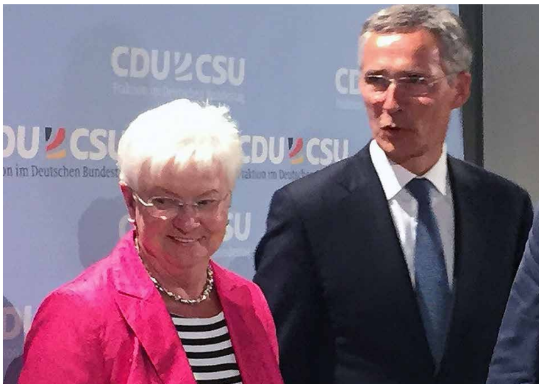
Gerda Hasselfeldt und der NATO-Generalsekretär Jens Stoltenberg

Mit NATO-Generalsekretär Jens Stoltenberg diskutierte der Fraktionsvorstand die internationalen Herausforderungen und Krisen der Welt. Ganze Regionen sind von Kriegen und Konflikten zerrüttet. Die Auswirkungen dieser Entwicklungen sind bis nach Deutschland und Europa zu spüren – nicht zuletzt durch die Flüchtlingsbewegung. Die Unionsfraktion hat deshalb jetzt ein Papier beschlossen, in dem sie ein Bekenntnis zu einer starken Bundeswehr in einer starken NATO ablegt. Die aktuellen sicherheitspolitischen Herausforderungen führen zu einer Rückbesinnung auf den Wert stabiler Bündnisse wie der EU und der NATO. Deutschland könne „Sicherheit nur gemeinsam mit unseren internationalen Partnern erreichen“, heißt es in dem Papier. Deshalb setzt sich die CDU/CSU-Fraktion für eine signifikante Erhöhung des Verteidigungshaushaltes ein.