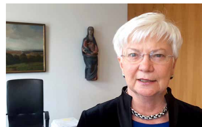
Gerda Hasselfeldt, 65

Das Thema ‚Autonomes Fahren‘ ist in der Zukunft keine Wunschvorstellung mehr. Ich glaube, dass wir schon bald dazu in der Lage sein werden, vor allem sicher und ohne Staus und völlig entspannt durch den Straßenverkehr zu kommen. Und ich bin ganz sicher, wenn wir weiterhin in Innovation, Forschung, Entwicklung und Wissenschaft die Rekordsummen investieren wie momentan, und vielleicht noch ein bisschen was oben drauflegen, dass so manche Träumerei zur Realität werden kann.