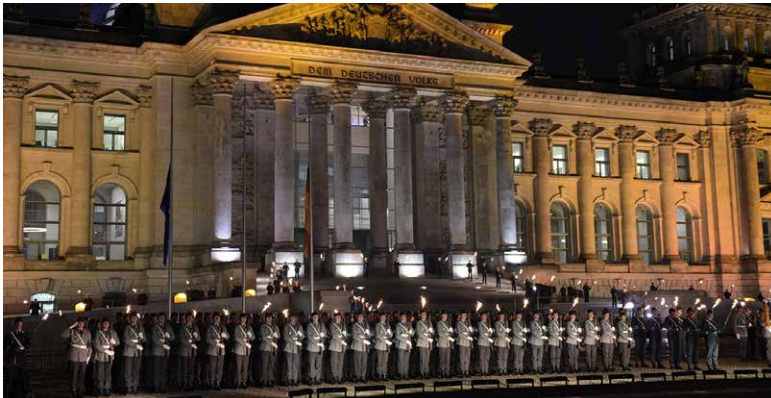
Großer Zapfenstreich anlässlich 60 Jahre Bundeswehr vor dem Reichstagsgebäude

60 Jahre Bundeswehr: ein Grund zum Feiern. Denn die Truppe ist ein tragender Pfeiler der freiheitlich-demokratischen Grundordnung. Am Donnerstag hat der Deutsche Bundestag in einer Debatte an die wechselvolle Geschichte der Bundeswehr erinnert.